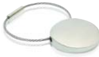
2.074 Metal Keyring Llavero metal