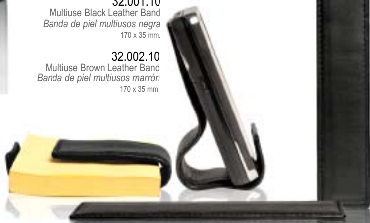
32.002.10 Multiuse Brown Leather Band Banda de piel multiusos marrón 170 x 35 mm.