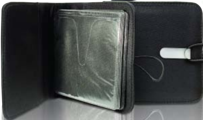
32.665 CD Holder Porta CD's 150 x 150 mm.