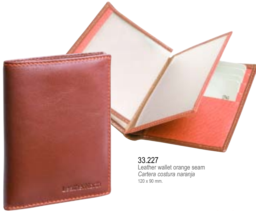
33.227 Leather wallet orange seam Cartera costura naranja 120 x 90 mm.