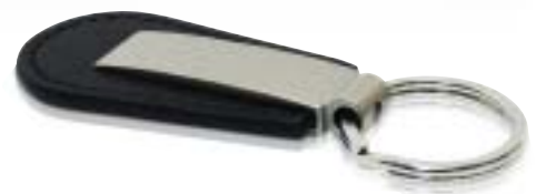
2.064 Metal-Leather Keyring Llavero piel y metal