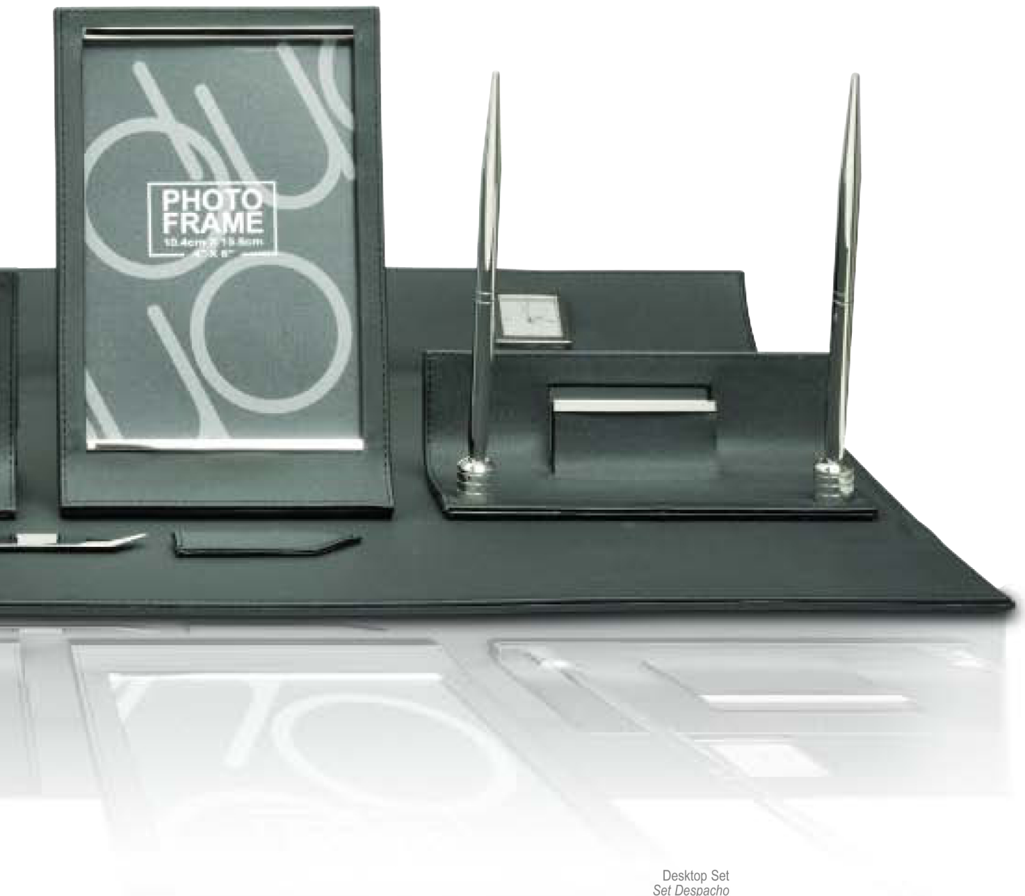
Desktop Set Set Despacho 435 x 410 x 105 mm.