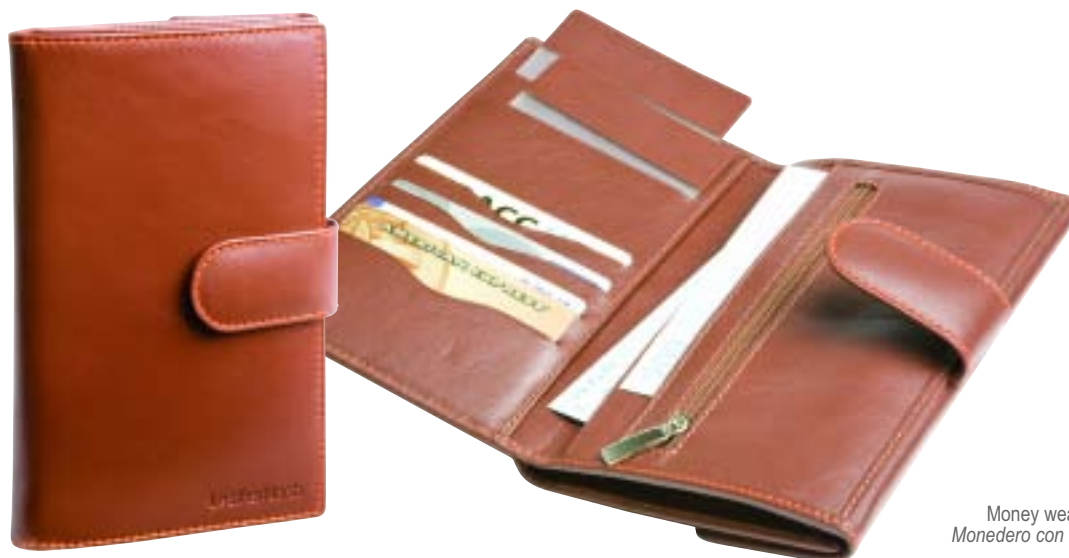
33.228 Money wear orange seam Monedero con costura naranja 175 x 110 mm.