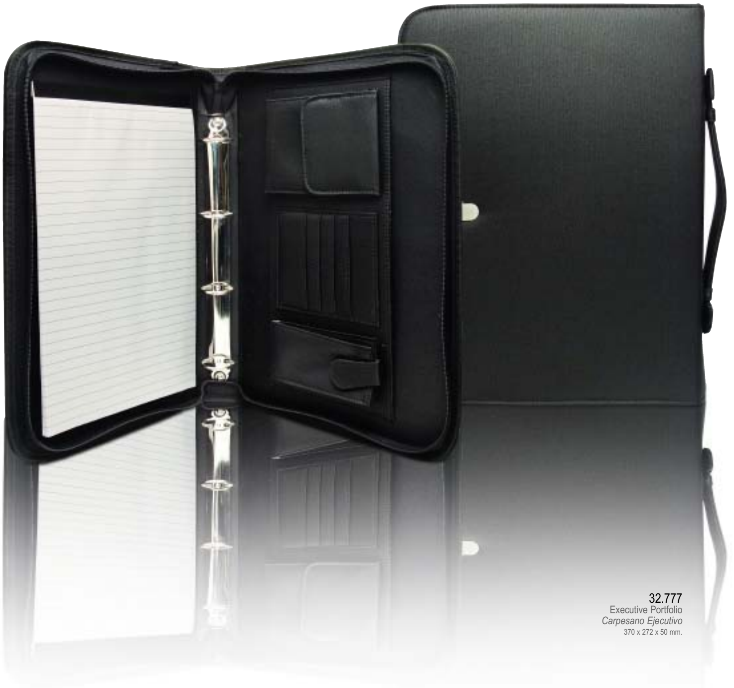
32.777 Executive Portfolio Carpesano Ejecutivo 370 x 272 x 50 mm.