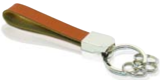
2.134 Metal-Leather Keyholder Llavero piel y metal