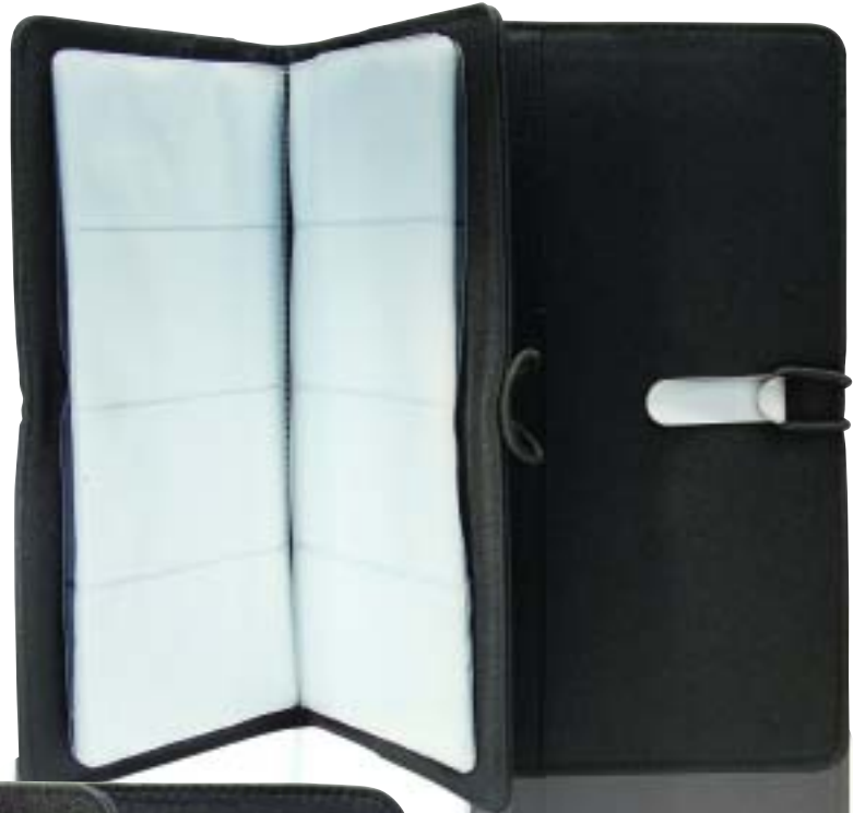
32.666 Cards Holder Portatarjetas 257 x 125 mm.