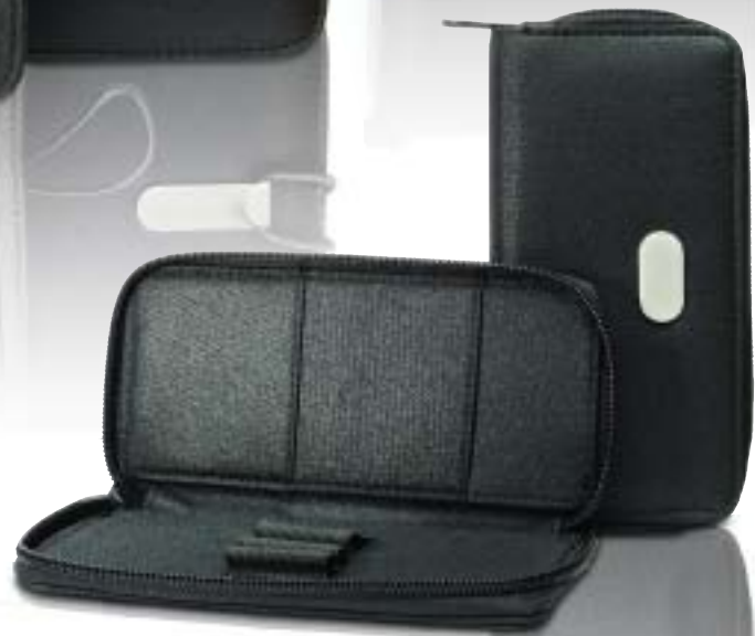
32.667 Pen Holder Porta boligrafos 165 x 80 mm.