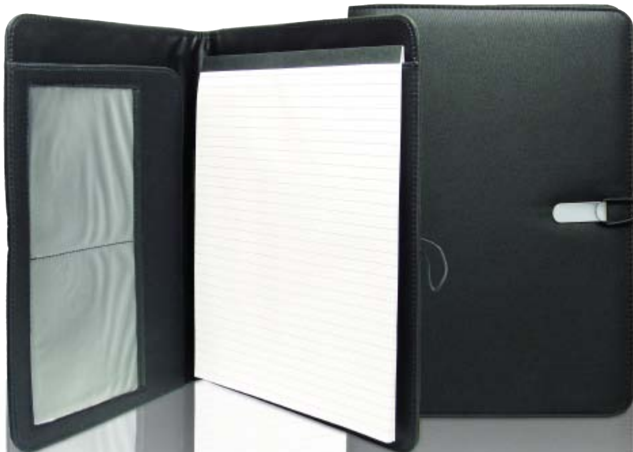
32.635 Portfolio Carpeta 330 x 240 mm.