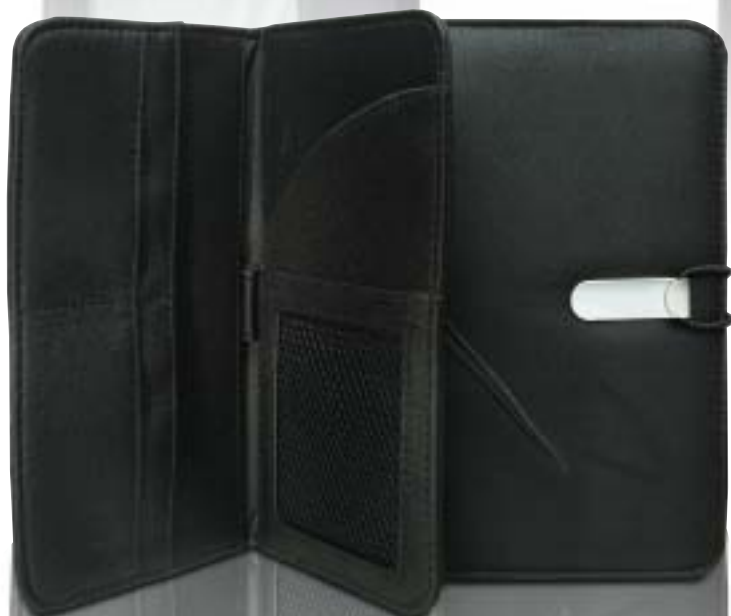
32.669 Briefcase Portadocumentos 218 x 122 mm.