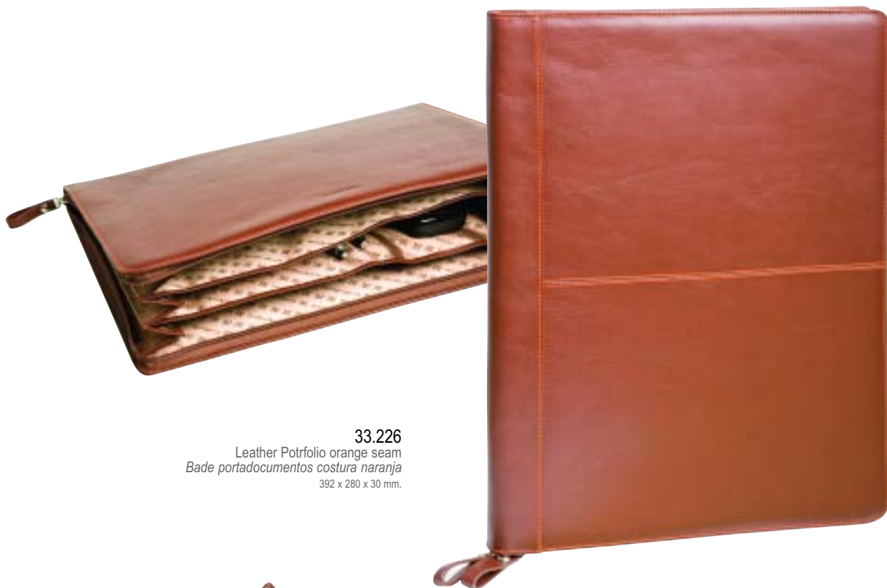
33.226 Leather Potfolio orange seam Bade portadocumentos costura naranja 392 x 280 x 30 mm.