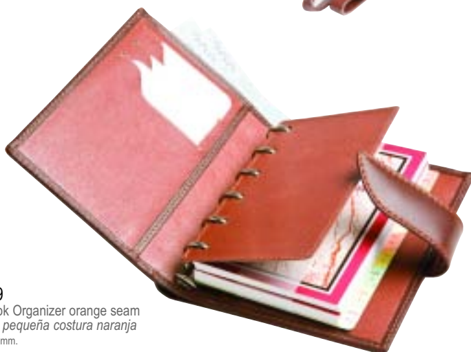
33.229 Notebook Organizer orange seam Agenda pequeña costura naranja 130 x 102 mm.