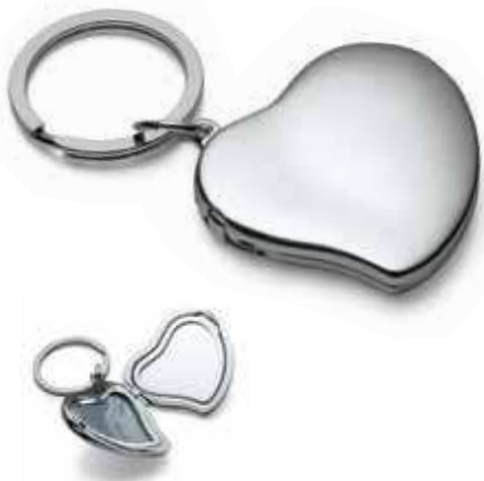
MEMORY HERZ Foto + Spiegel 193007 photo + mirror 5 x 5 cm, Nickel, hochglanzpoliert mirror polished