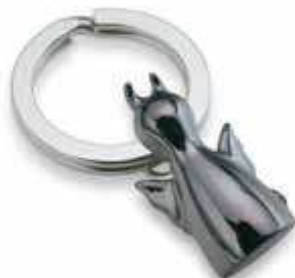
DIABOLO 2,8 cm (h) 193236 schwarz verchromt black chrome Design: Eberhard Woike