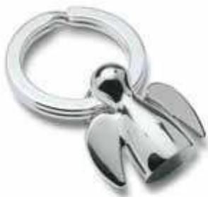
ANGELO 2,8 cm (h) 193210 Nickel, poliert / polished Design: Eberhard Woike