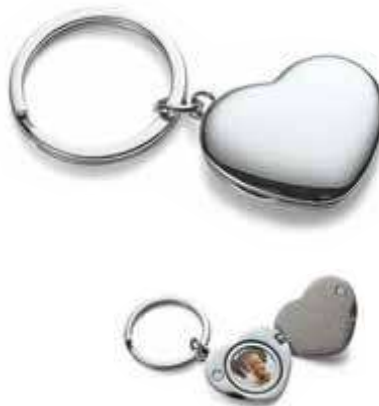
HEART 3,8 x 3,2 cm 195213 Chrom, hochglanzpoliert mirror polished