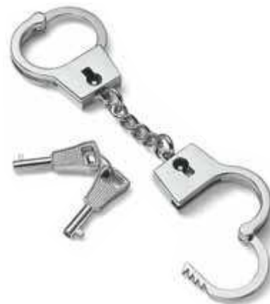
GUILTY SCHLOSS / SCHLÜSSELRING LOCK / KEY RING 10 cm (l) 107004 Nickel, hochglanzpoliert mirror polished